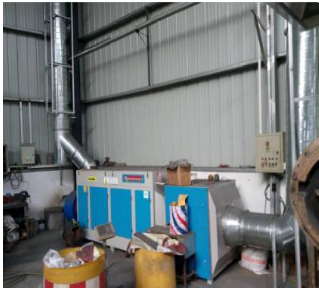
活性炭-光氧催化废气净化器